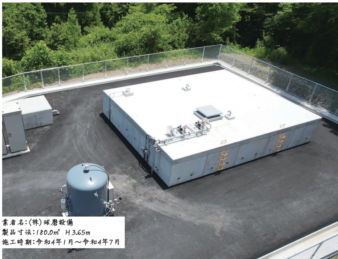
業者名：(株)球磨設備 製品寸法：180.0㎡ H3.65m 施工時期：令和4年1月～令和4年7月